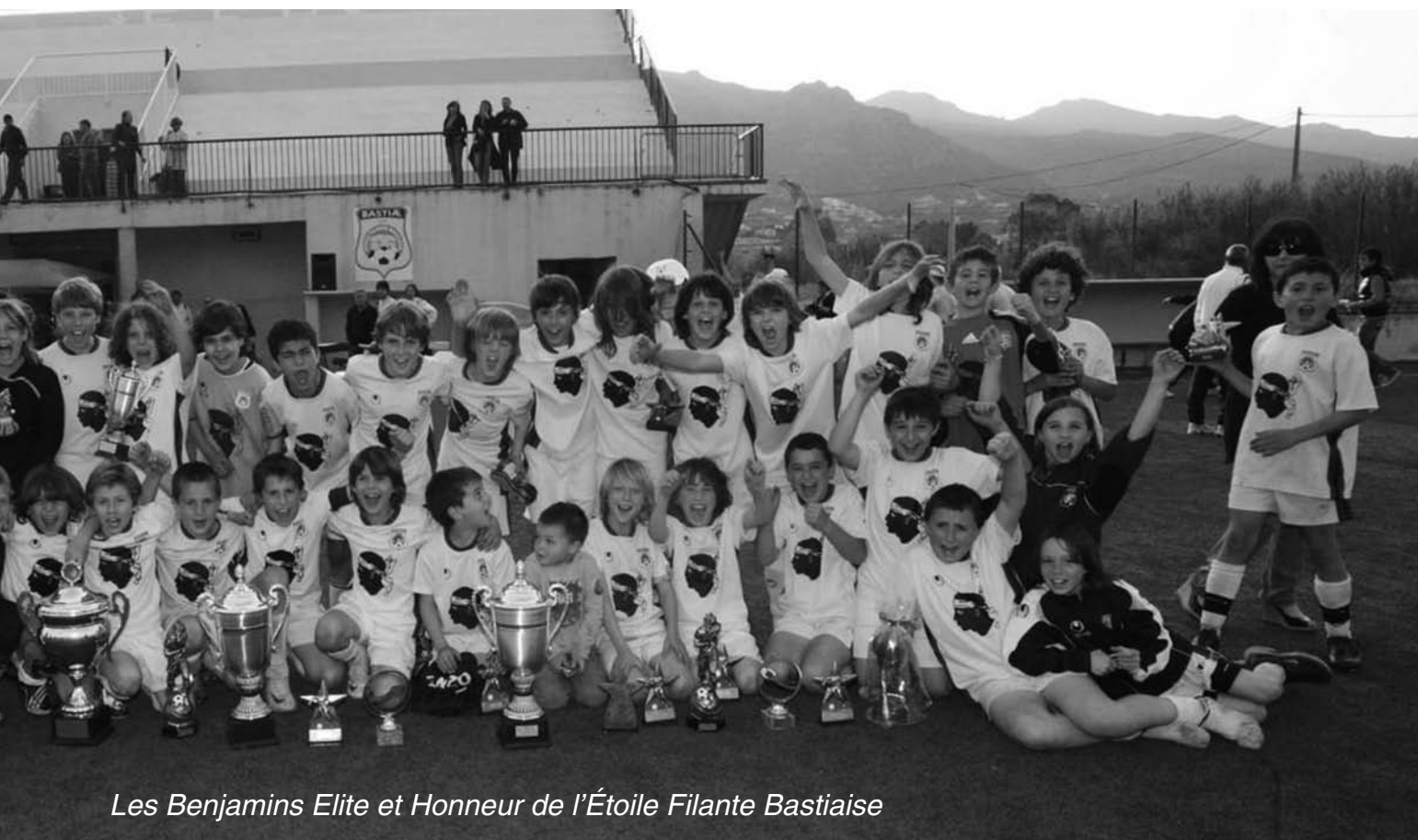
Les Benjamins Elite et Honneur de l'Étoile Filante Bastiaise